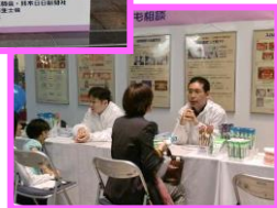
歯のなんでも相談