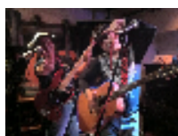
5.4(Sat) ニシカズ (ギターデュオ) MC: noa