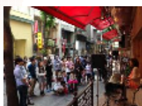
5.3(Fri) MICA (シンガーソングライター) MC: 渡辺大輔